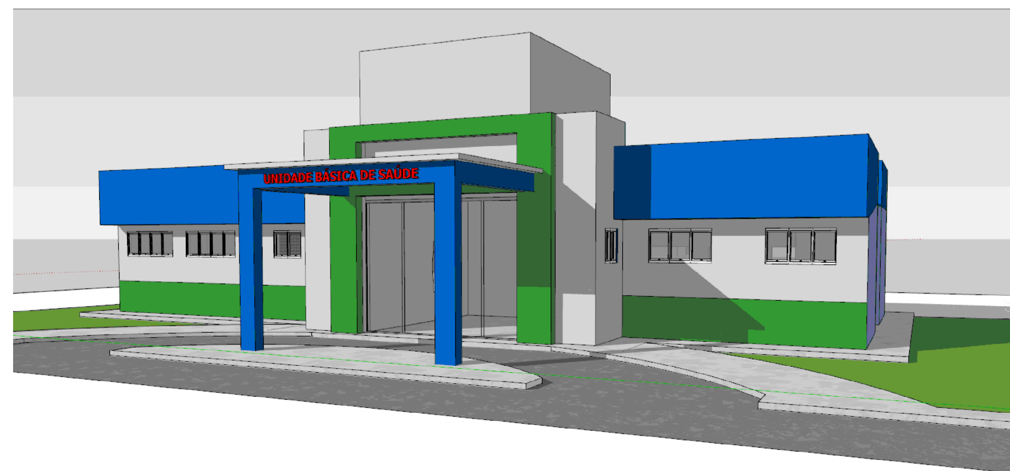
PERSPECTIVA FACHADA sem escala