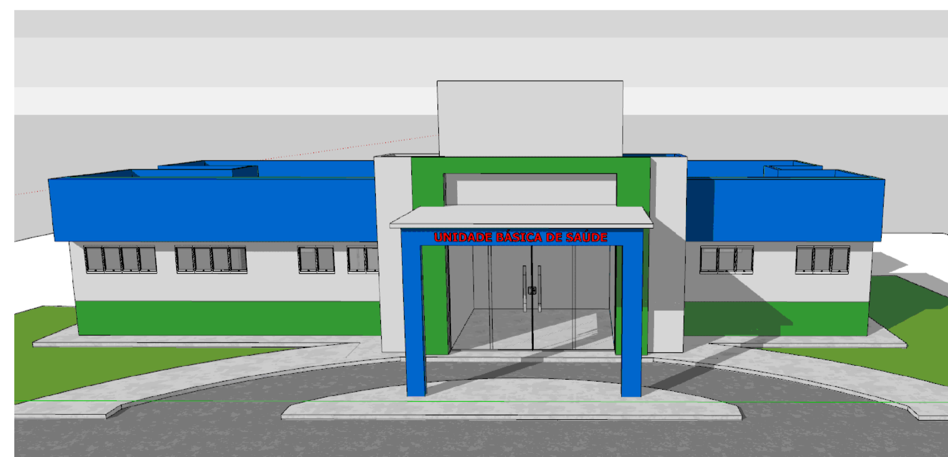
PERSPECTIVA FACHADA sem escala