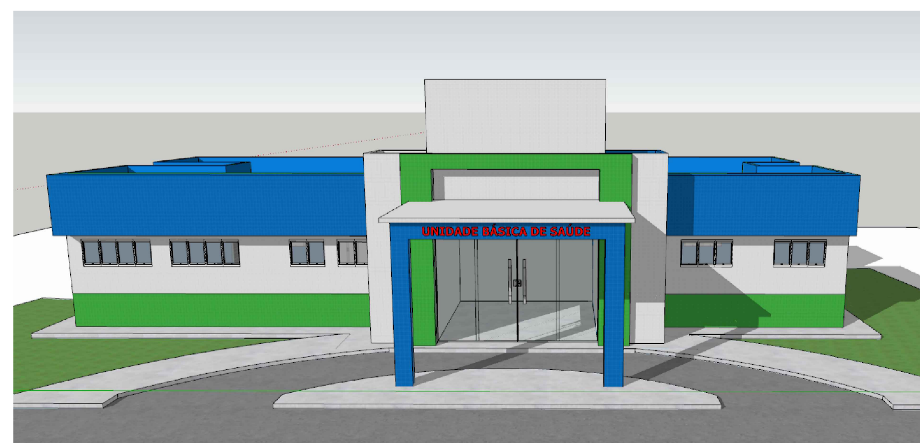
PERSPECTIVA FACHADA sem escada