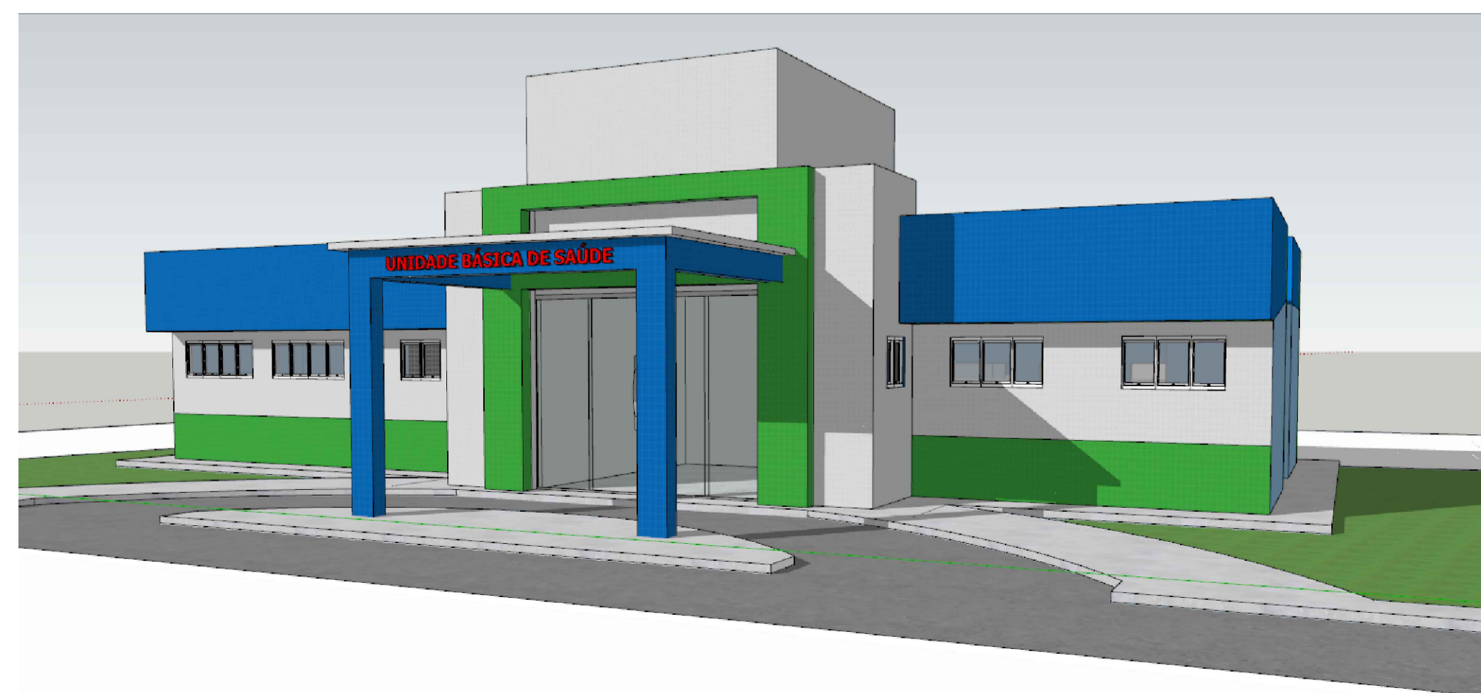
PERSPECTIVA FACHADA sem escada